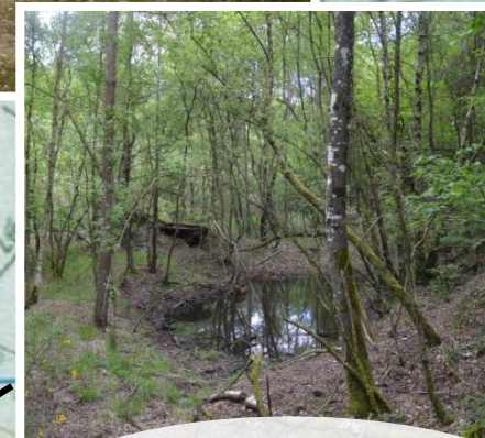
2 petites mares ; point de ravitaillement... ... pour les animaux !